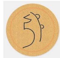
Ki Sei He Ki