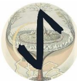
Ihwaz/Aiwass T.O.F., A.O.H.